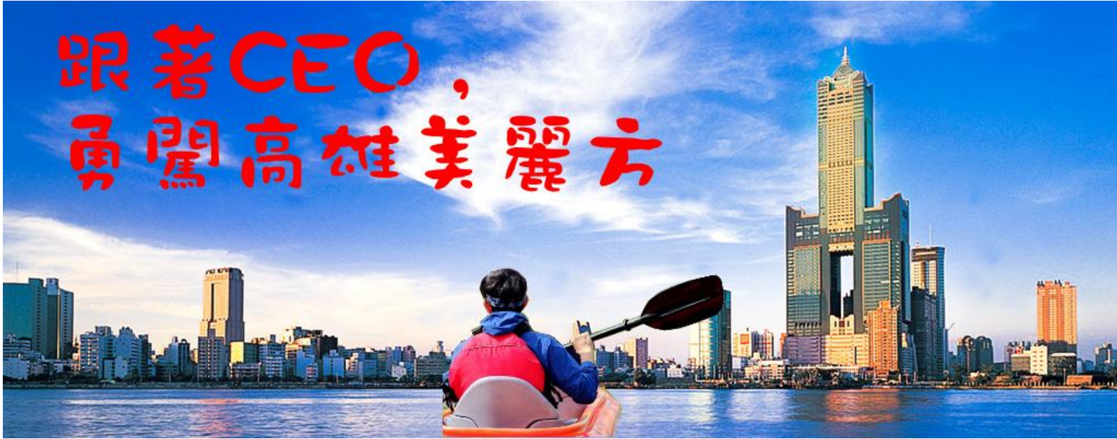
2019 跟著 CEO 勇闖高雄美麗方活動流程表